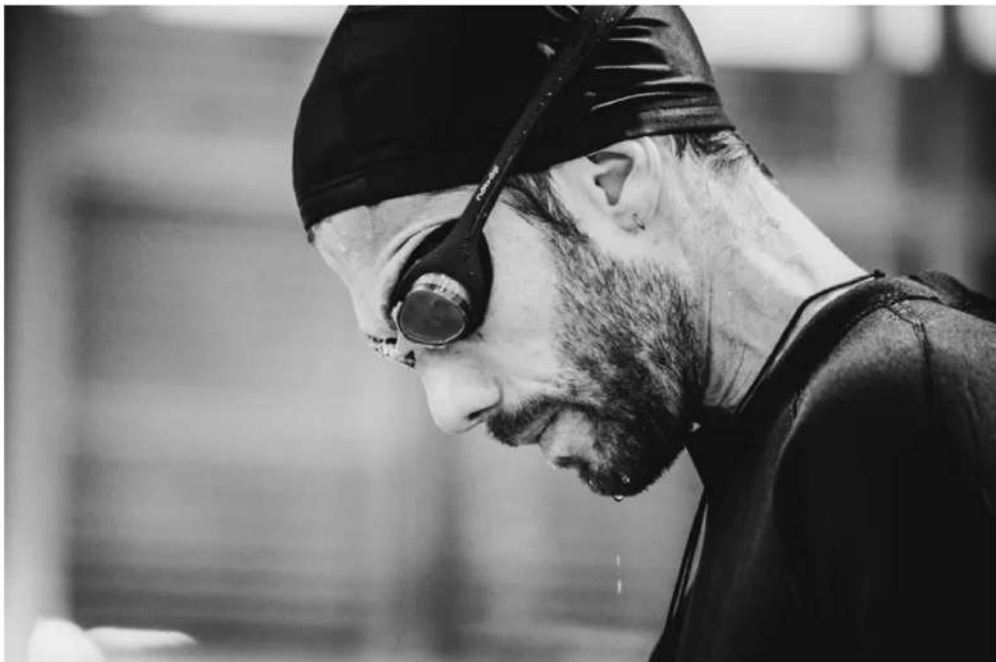
Like Me de la Compagnie dans l'arbre. - Kalimba

Ce dispositif leur permet d'obtenir environ 20.000 euros pour couvrir les frais de location de salle par exemple, mais également de la visibilité. Depuis le lancement de l'accompagnement en 2000, une centaine de spectacles de la région ont été soutenus par ce dispositif . Découvrez la sélection 2022 :